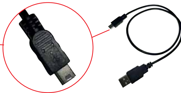
A töltőkábel tartozék